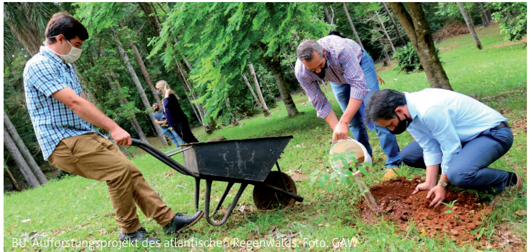
BU: Aufforstungsprojekt des atlantischen Regenwalds.

Am Samstagnachmittag (9. Mai) feiert das Gustav-Adolf-Werk zusammen mit unserer Kita von 14 bis 17 Uhr sein Jahresfest. Seit 2012 beteiligt sich das Gustav-Adolf-Werk an dem Aufforstungsprojekt der Diakonie in Argentinien, Paraguay und Uruguay. Die Ev. KiTa und die Ev. Krippe Spatzennest unterstützen dieses Aufforstungsprojekt, damit dort Kinder, Jugendliche und Familien wieder eine nachhaltige Lebensgrundlage, Bildung und Perspektive erhalten. Für das leibliche Wohl ist gesorgt, die Ohren und Augen genießen eine Aufführung des Kita-Chores. Und am Sonntag, den 10. Mai feiert das Gustav-Adolf-Werk im Rahmen seines Jahresfestes um 10 Uhr in der Bloherfelder